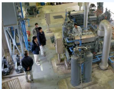
写真 排水ポンプの診断

(注：右図は当社の調査実績による値であり、性能劣化率は使用状況など様々な要因が絡むため、すべてのポンプに対して適用できるものではありません。)