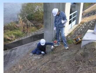
写真 CCD カメラ調査

土木構造物の中でも、排水機場の建屋や樋門門柱部などの地上に突出している部分は外観目視により損傷状況や劣化状況がある程度特定できますが、地中埋設部は目視などの簡易調査では構造物の損傷や周辺地盤との空洞化などの状況が十分に把握できません。そこで CCD カメラ調査や地下レーダ探査により、構造物の損傷や空洞化状況を精密に把握・診断・評価し、対策工法の選定に必要な情報を収集します。